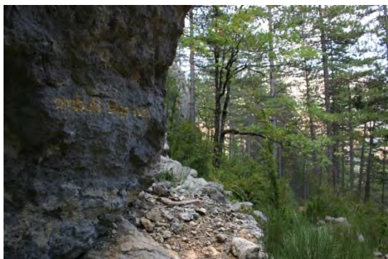
Fig.5 : herman de vries, ambulo ergo sum , (2001), Vallée du Bès. Musée Gassendi, Digne-les-Bains).

Nulle nostalgie de sa part, toutefois : si herman de vries a été très attentif à la désertification de la vallée du Bès où se situe son œuvre, sa philosophie intègre la mort et la disparition comme une donnée de la vie elle-même. Il n'est pas davantage hanté par la perte des cultures : « la campagne de Haute Provence se dépeupla à la fin du 19 e et au début du 20 e siècle. Ce fut un processus dramatique, en partie dû aux dommages écologiques, à la Première Guerre mondiale qui fit de nombreuses victimes parmi la population masculine, et au développement de l'industrie, qui attira dans les villes comme Marseille une population se détournant du pénible travail des champs. le paysage se transforma, la nature reprit ce que l'homme lui avait pris et démontra sa grande aptitude à guérir, la végétation se mettant à recouvrir la moindre parcelle de terrain abandonnée par les hommes. » (de vries, 2003)