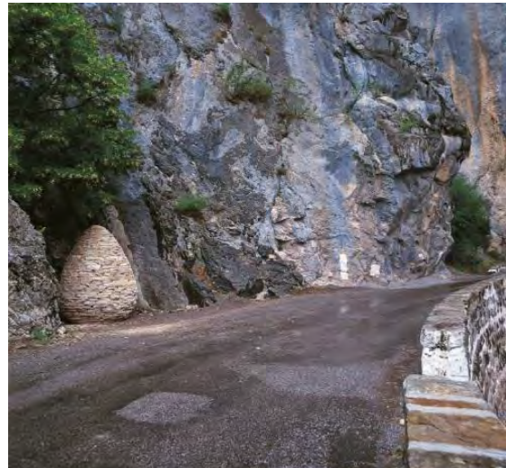
Fig. 1. Andy Goldsworthy, Sentinelle, Clues de Barles (1999). Musée Gassendi, Digne-les-Bains, France.

Sa première attitude avait été de reprendre le mode opératoire qui lui était habituel à cette époque : créer des œuvres éphémères avec la pierre, l'eau, la lumière. Toutefois, le contexte de l'association entre le musée et la réserve naturelle géologique l'a progressivement conduit à substituer à un usage épisodique du paysage un engagement durable et structurel dans le paysage, ce à quoi concourt Refuge d'Art , une œuvre qui se déploie dans l'espace et dans le temps (Goldsworthy, 2008).