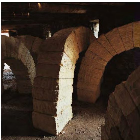
Fig. 2 : Andy Goldsworthy. Refuge d'Art, Ferme des belons (2003). Musée Gassendi, Digne-les-Bains, France. Photo Andy Goldsworthy.

Quant au choix des sites, il est significatif qu'il a souvent été le fait de l'artiste lui-même, en fonction de la marche et des endroits à traverser mais qu'il a aussi parfois été dû à l'intervention des habitants eux-mêmes. Ainsi, Refuge d'Art : ferme des belons m'a été proposée par le maire du village de Draix au motif que cette ferme avait été une ancienne école de cadres de la Résistance et qu'un groupe de résistants y avait été arrêté. Le défi, que Goldsworthy a accepté, était d'intégrer cette mémoire communale dans son œuvre sans pour autant en faire un monument : les randonneurs dorment au premier étage de la ferme reconstruite, tandis que le rez-de-chaussée – anciennement la bergerie – est occupé par une série d'arches massives en pierre qui rendent l'espace non fonctionnel (fig. 2).