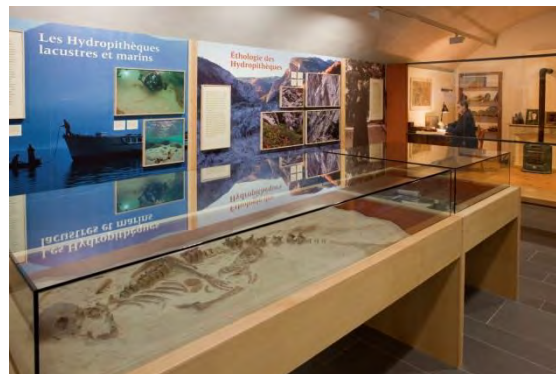
Fig. 9 : Joan Fontcuberta, Le cabinet des hydrométhodes (2013). Musée Gassendi, Digne-les-Bains. France.

Le même constat est à faire à propos de Fontcuberta : la scénographie dont il use est très directement héritée des modes de la muséographie scientifique telle qu'elle se pratique dans les musées des sciences, ainsi que dans les musées des techniques et de l'histoire naturelle : il utilise des dioramas, ses vitrines comportent un très grand nombre d'échantillons, ses cartels fournissent de longues explications et utilisent un vocabulaire hyperspécialisé à la limite de l'obscurité (fig. 9). Ce faisant, cet artiste brouille les limites entre art et science et interroge l'impression de rigueur, d'objectivité, de neutralité et d'exhaustivité que prétendent donner la science et le musée. Avec ses œuvres, les visiteurs comprennent que le musée est le produit d'une histoire, qui ne peut donc s'arrêter et être figée, qui doit au contraire être contestée, dépassée et réactualisée en permanence. Autre manière de remettre en marche l'institution, la fidélité au projet muséal passe par les infidélités qu'on lui fait.