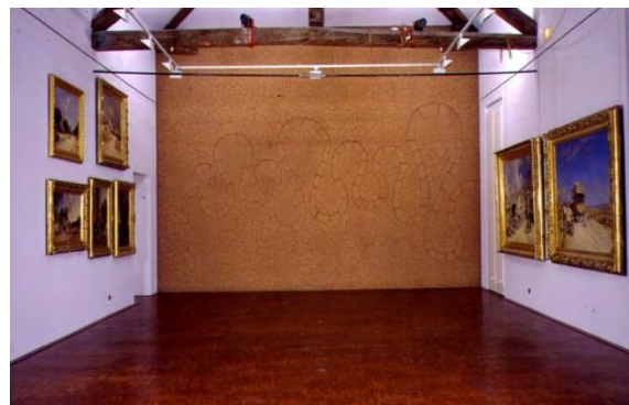
Fig.7 : Salle des paysages, Andy Goldsworthy, River of earth (1999). Musée Gassendi, Digne-les-Bains, France.

Par exemple, River of earth , grand mur de terre séchée d'Andy Goldsworthy, ne fait pas seulement du musée Gassendi le premier des Refuge d'Art ; son œuvre se situe dans la galerie des peintres paysagistes du 19 e siècle, fondateurs du musée Gassendi, mais qui, dans leurs tableaux, inventent de toutes pièces une Provence idéalisée et mythique (fig.7). Lorsqu'il nous invite à penser plus profondément les différentes stratégies de représentation du monde visible, Goldsworthy oppose donc aussi à ces fictions la réalité de la terre telle qu'elle est, même si, en l'occurrence, son argile vient de Penpont en Écosse.