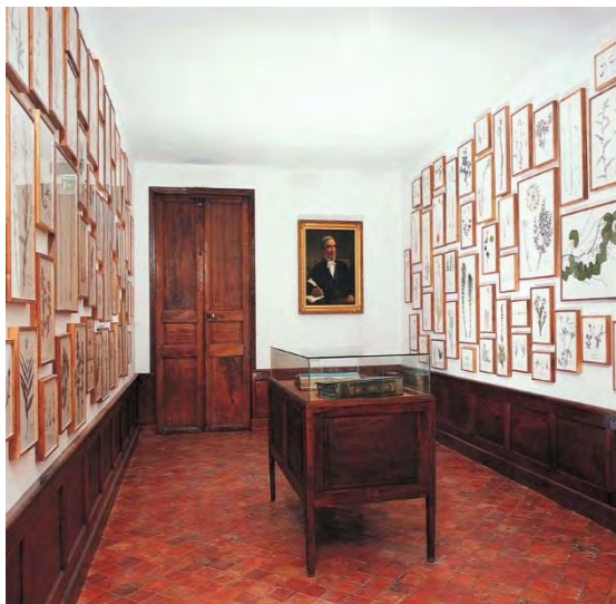
Fig. 8 : herman de vries, le cabinet de botanique en l'honneur du docteur honorat (2003). Musée Gassendi, Digne-les-Bains. France

complètent et se nourrissent l'un de l'autre en un voisinage qui les enrichit mutuellement.