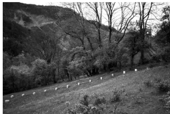
Fig. 3 : Richard Nonas. Edge-Stones, Vière (détail) (2011). Musée Gassendi, Digne-les-Bains. Photo Richard Nonas

Comment cette œuvre de Nonas se présente-t-elle ? Pour en juger, il faut savoir que le hameau aujourd'hui abandonné est situé à 1200m d'altitude au fond d'une étroite vallée ; on n'y accède qu'à pied par des sentiers en surplomb. La première vue qu'il offre est celle d'une prairie entretenue par le pâturage, qui constitue une limite entre le hameau et la montagne. C'est là qu'est implantée la première des lignes de pierres de Nonas (fig. 3). Sur une deuxième prairie, la ligne de connexion entre le moulin, le verger et l'école est marquée par un autre alignement de pierres de Nonas. Le troisième alignement derrière la paroi rocheuse est la dernière lisière de Vière, sa barrière immédiate contre l'invasion de la forêt, mais aussi sa connexion la plus directe avec les deux ou trois autres hameaux minuscules jadis semés plus bas dans la vallée, dans l'ancienne paroisse de Mariaud. L'intervention de Richard Nonas est complétée par la pose d'une couverture partielle du toit en mélèze sur l'église romane en ruine, visant à arrêter le processus de destruction et à offrir un abri pour la nuit à des randonneurs.