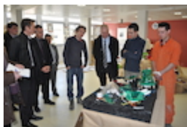
Les lycéens présentant leur projet lors de l'inauguration de La Semaine des Arts