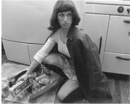
Cindy Sherman, Untitled Film Still # 10 (1978) Cindy Sherman, Untitled Film Still # 21 (1981)

Née en 1954 à Glen Ridge (New Jersey, USA), Cindy Sherman vit et travaille à New-York. Dès ses tout premiers travaux, elle se sert presque exclusivement de sa propre personne comme modèle et support de ses mises en scènes. Jeu de rôles photographique, l'artiste cache sa propre identité derrière celle de personnages qu'elle invente à l'aide de maquillage, de prothèses, de vêtements. Cindy Sherman incarne des personnages, principalement féminins, issus de la culture populaire : la femme au foyer, la femme fatale, etc. Ses photographies ne sont pas de simples pastiches de l'imagerie de la femme, mais une réflexion sur la façon dont notre identité est façonnée par les modèles que véhiculent les médias et le cinéma.