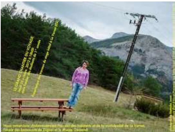
Le stage d'initiale de l'Ecole supérieure d'art d'Aix-en-Provence au Vernet