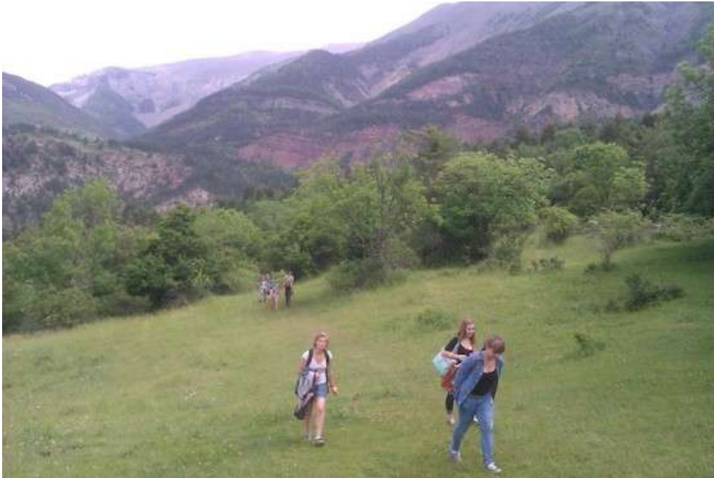
Sortie au Vieil Esclagon avec 2 classes de troisièmes de Nyons, Drôme.